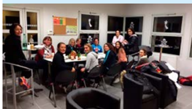
Les équipes féminines