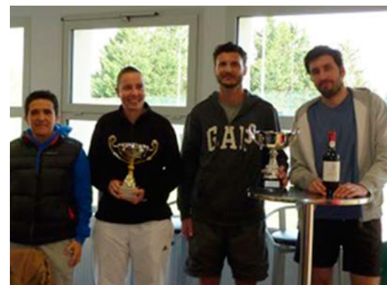
Rendez-vous l'an prochain

assisté à de jolies rencontres même s'il n'est pas toujours évident de jouer face à un partenaire membre du club. Nous remercions aussi tous les fidèles supporters et surtout supportrices ! Et mention particulière cette année pour nos jeunes ados rentrés dans la compétition pour la 1 re année et qui ont brillé par leurs résultats ; même pas complexés face à la maturité et à l'expérience de leurs aînés ! Bravo à eux et nous les encourageons à poursuivre leur ascension tennistique !