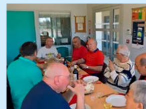
À table !

ments, on regarde ensemble des matches à la télé (et pas seulement du tennis) et surtout, on mange ensemble. Les petits, les équipes, les vieux, pardon, les Vétérans. Goûters, raclette, cassoulet ; et ce n'est pas fini, le temps des grillades arrive. Et c'est joyeux (même si ça n'apparaît pas vraiment sur la photo du cassoulet des vétérans !). Ces bâtiments vivent ! Que c'est agréable de les voir éclairés et animés, le soir ! Bref, tout le monde est heureux, de 5 à 7... ans.