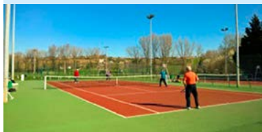
Vendredi matin, sur le terrain

C comme Convivialité et Compétition A Comme Accueil et Amitié T comme Tennis, bien sûr.