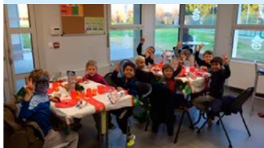
Les futurs petits as